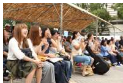
昨年度環境デーなごや 2016 会場の様子